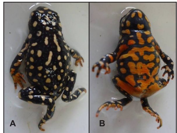
Figura 2. Vista dorsal (A) y ventral (B) de Melanophryniscus fulvoguttatus (MNHNP 11484).

Comentarios. — Melanophryniscus fulvoguttatus (Mertens, 1937) se encuentra presente en Brasil en el Estado Matto Grosso do Sul (Prigioni y Langone, 1998) y en Argentina se restringe a la provincia de Formosa (Lavilla et al. , 2002). Anteriormente se encontraba citado para las provincias de Santa Fe (Baldo y Arzamendia, 1997) y Santiago del Estero (Basso y Williams, 1996) pero el reexamen del ma-