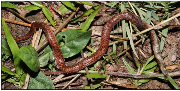
Figura 2. Ejemplar de Atractus reticulatus colectado en la localidad de Quiindy.

En este trabajo reportamos un nuevo registro para A. reticulatus en el distrito de Quiindy, departamento de Paraguari, perteneciente a la ecorregión Chaco Húmedo según la clasificación de Dinerstein et al. (2017) (Fig. 1), extendiendo su distribución 175 km al noroeste del registro más cercano, en Itapúa (Cabral 2014; Cacciali et al. , 2016). El ejemplar colectado (Permiso SEAM N°244/2017) fue hallado muerto, con laceraciones en el primer tercio y a la mitad del cuerpo, el 18 de septiembre de 2018 entre las 20:00 h-20:30 h con cielo despejado, temperatura 23° C y con humedad relativa de 80% en un pastizal de suelo húmedo y semicubierto por vegetación (Fig. 2). En laboratorio se realizaron conteos de escamas y mediciones, encontrando: 15-15-15 dorsales,