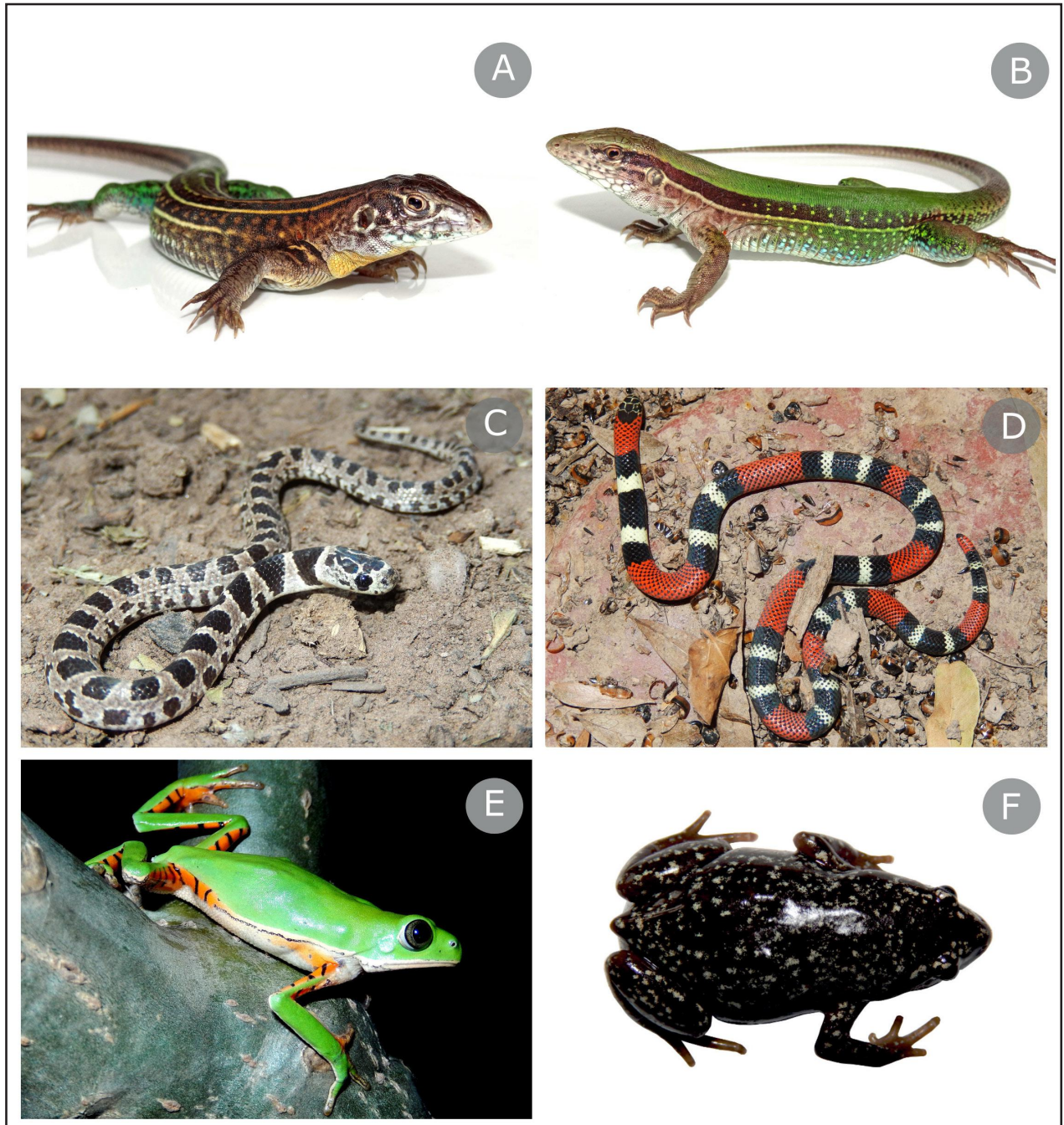
Figura 2. Muestra de los lagartos, serpientes y anfibios registrados en el área de estudio. A) Teius teyou B) Ameiva ameiva C) Sibynomorphus turgidus D) Micrurus aff. pyrrhocryptus E) Phyllomedusa azurea F) Chiasmocleis albopunctata .

arrojan resultados equivalentes, con alrededor de 4 a 9 especies por punto de muestreo (Céspedes et al. , 2001; Scrocchi y Giraudo, 2005; López y Prado, 2008; Cano y Leynaud, 2009). En comparación con localidades del Chaco Seco (Chaco Semiárido + Chaco Árido), la riqueza de lagartos del Chaco Húmedo parece ser menor a escala local. Sitios del Chaco Seco muestreados con trampas y búsquedas activas, presentaron entre 9 y 14 especies de lagartos