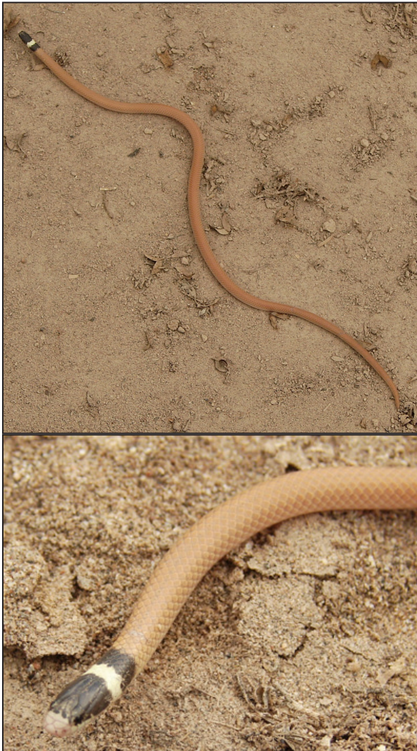
Figura 2. Ejemplar de Phalotris cuyanus (Fotografía depositada en colección FML 28965) de la Reserva de Biosfera Ñacuñán (Mendoza) en vista dorsal general y detalle de la cabeza.

Phalotris matogrossensis y P. tricolor : una evaluación de sus caracteres diagnósticos (Squamata, Colubridae). Cuadernos de Herpetología 21: 75-82.