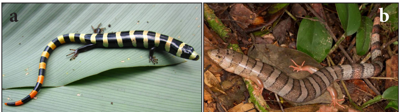
Figura 1. Diploglossus fasciatus , campamento Corazón del Madidi, Parque Nacional y Área Natural de Manejo Integrado Madidi, La Paz Bolivia. a. juvenil, registro fotográfico. b. macho (CBF 3699).

La coloración entre adultos y juveniles es claramente diferente (Fig. 1a y b.), los juveniles presentan un patrón de coloración aposemático, caracterizado por bandas negras y blancas. Según Pianka y Vitt (2003) este se asemejaría el patrón de coloración de miriápodos tóxicos simpátricos. En los adultos