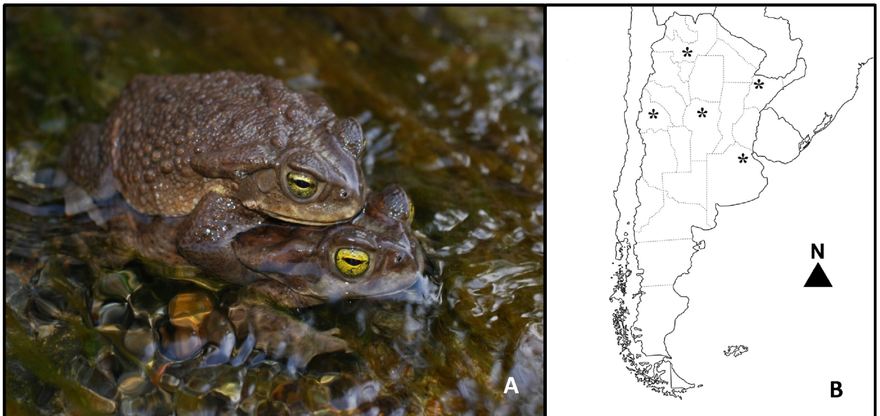
Figura 1. A. Amplexo de Rhinella arenarum . B. Ubicación de las poblaciones de Aplectana hylambatis .

bras, 5 machos) (Fig. 1A) fueron colectados durante Septiembre de 2004 en el Parque Provincial Presidente Sarmiento (S 31.55863; O 68.71869, Altitud: 765 m, Datum: WGS 84), Departamento Zonda, San Juan, Argentina. El ambiente es un humedal que se encuentra rodeado por una matriz xérica que pertenece al Desierto del Monte. En estos ejemplares fueron examinados todos los sistemas de órganos. Los nematodos fueron recolectados, contados, estudiados in vivo ; luego, fueron fijados en formaldehído al 10% y para el estudio de su anatomía interna fueron aclarados con lactofenol de Amann. Los ejemplares fueron identificados mediante trabajos específicos (Gutiérrez, 1945; Baker, 1980; Baker y Vaucher, 1986) y se encuentran conservados en alcohol al 70°. Los dibujos fueron hechos con un microscopio