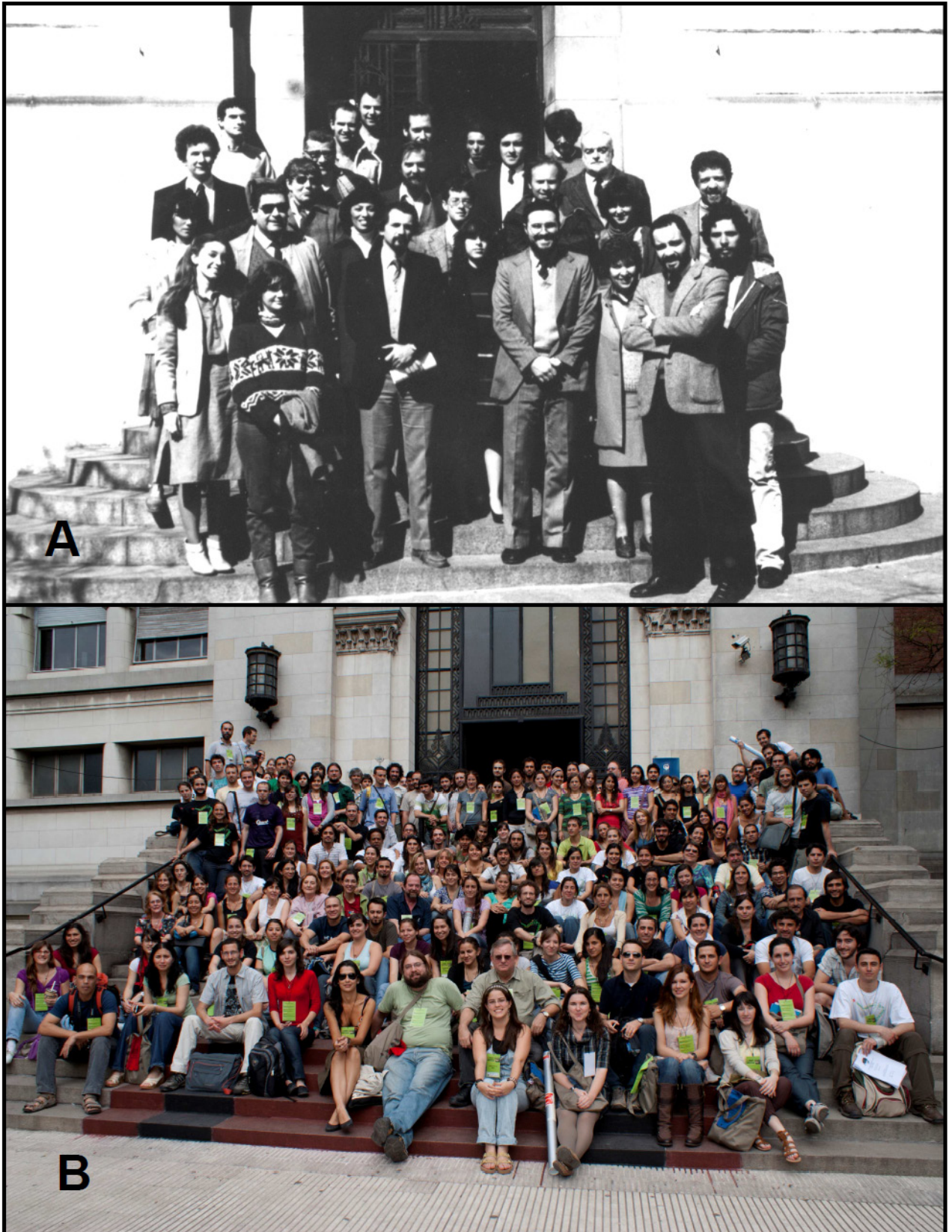
Figura 1. A: Asistentes a la I Reunión de Comunicaciones Herpetológicas. Buenos Aires, 6 de septiembre de 1983. B: Asistentes al XI Congreso Argentino de Herpetología, Buenos Aires, 22 de octubre de 2010.