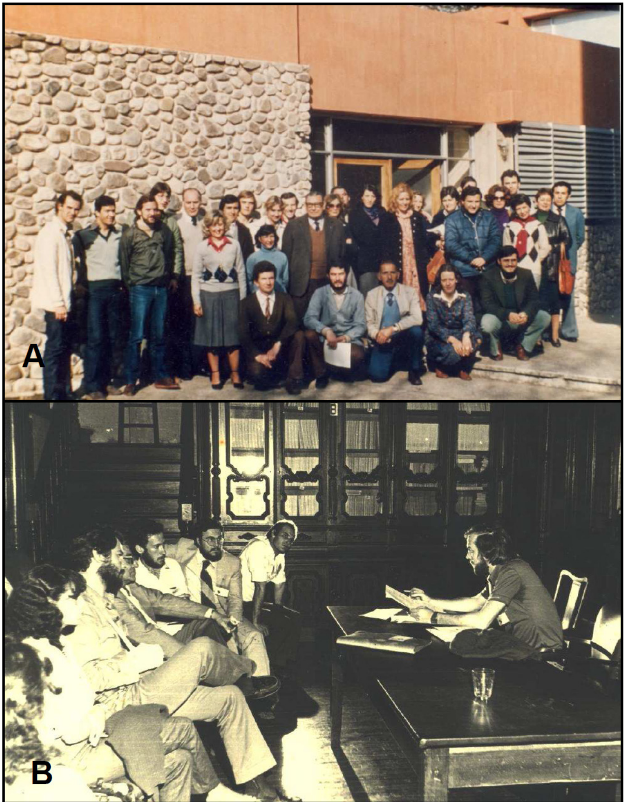
Figura 2. A: Asistentes al Curso de Herpetología Argentina en el Centro de Zoología Aplicada UNC. Córdoba, agosto de 1980. B: Lectura del borrador de las actas fundacionales de la AHA durante las VI Jornadas Argentinas de Zoología. La Plata, octubre de 1981.