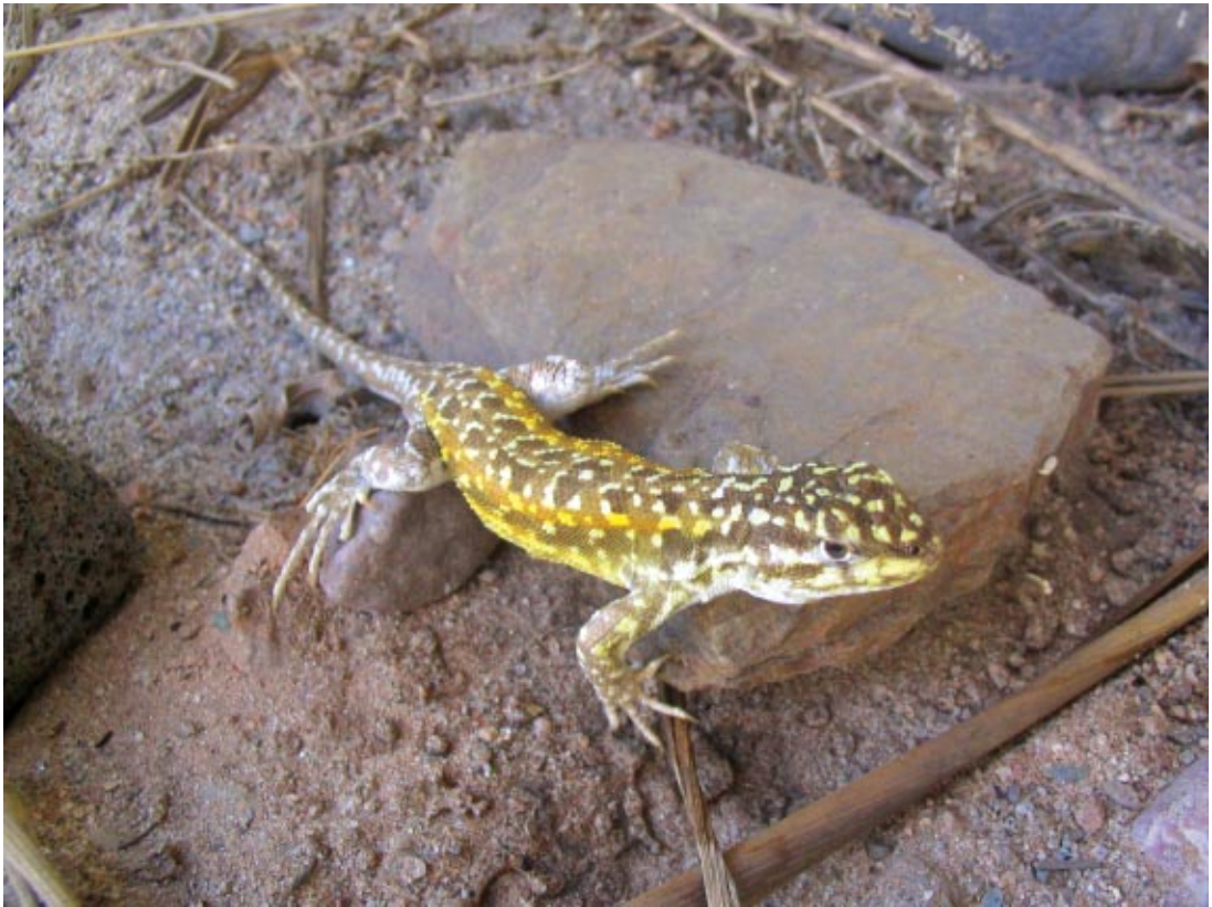
Figura 7. Macho adulto típico de L. ornatus , de la localidad de Abra Pampa, provincia de Jujuy, Argentina.

achaparrada, abundando los cardones. En las cercanías de La Poma se observan algunas jarillas ( Larrea sp.), evidenciando una zona de transición entre las provincias fitogeográficas de prepuna y monte (Cabrera y Willink, 1980), el suelo presenta gran cantidad de rocas volcánicas mezcladas con arena. En esta área L. lavillai es simpátrida con L. puna . En las alturas de la quebrada del Acay, la vegetación cambia radicalmente transformándose en una zona típica de puna y el suelo está cubierto por grandes rocas volcánicas y metamórficas. En esta área L. lavillai es simpátrida con L. ramirezae y L. dorbignyi . L. lavillai es reemplazado por L. albiceps hacia la ladera norte del Acay.