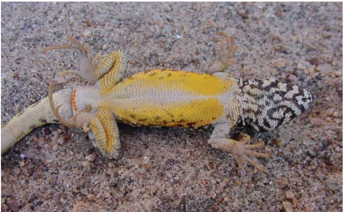
Figura 1 (arriba). Macho adulto de L. lavillai , se observan las bandas dorsolaterales evidentes de color amarillo.