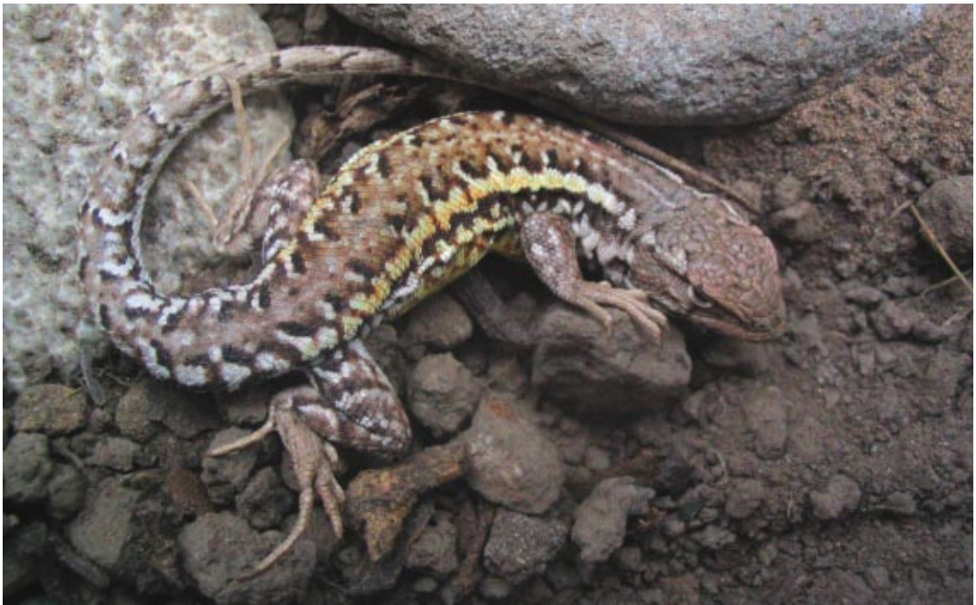
Figura 3 (arriba). Hembra adulta de L. lavillai , se observan las bandas dorsolaterales tenues, la ausencia de manchas paravertebrales en el cuerpo y el diseño típico de la cola.