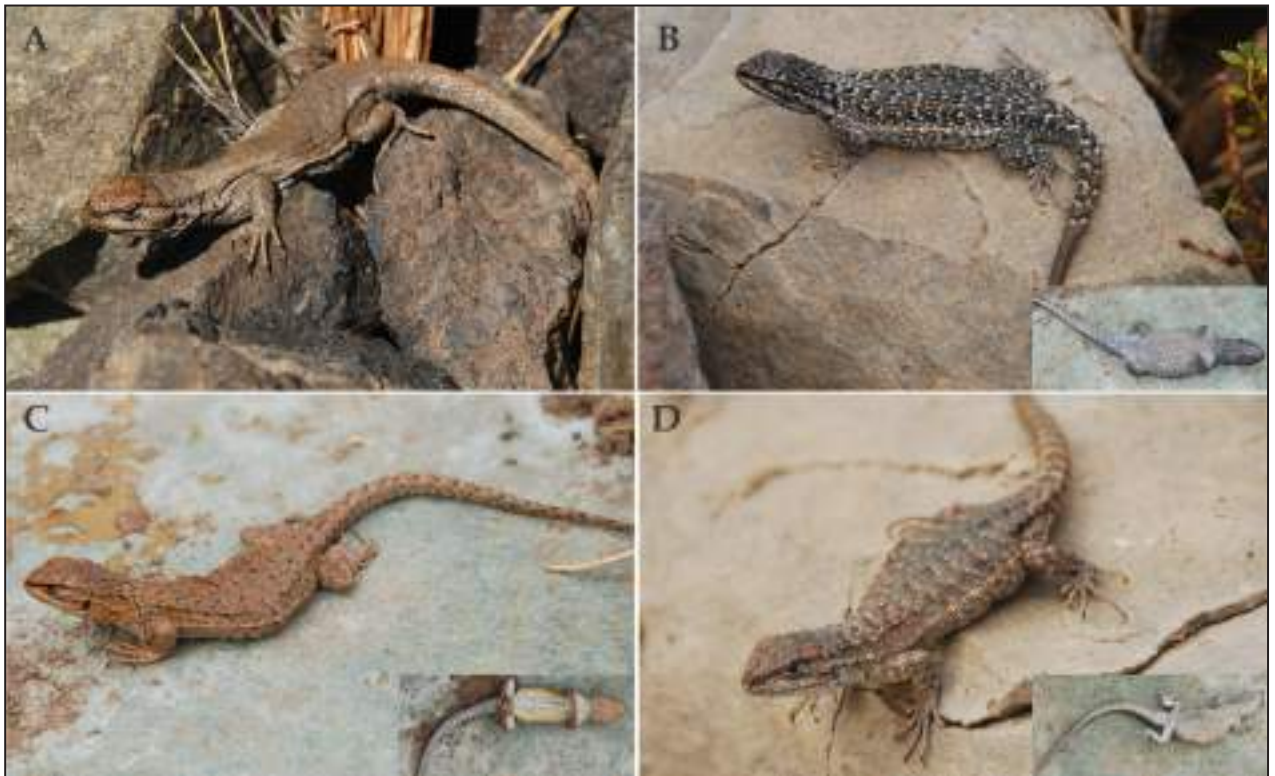
Figura 6. Vista dorsal de hembras paratipos de Liolaemus hauthali sp. nov. A: Pampa del Leoncito, ruta a Laguna Brava, La Rioja. B, C y D: 42 km de Alto Jagüe ruta hacia Pampa del Leoncito, La Rioja.

ejemplares se destacan evidentes manchas negras de tamaño y forma variable, siendo la mayoría de forma subcuadrangular. En la mayoría de los ejemplares en que las manchas paravertebrales son pequeñas están ausentes las manchas laterales del cuerpo. Tanto en el dorso del cuerpo como en los lados hay numerosas escamas de color celeste, amarillo o blanco que le dan un colorido especial. Los miembros anteriores y posteriores tienen el mismo diseño y color que el dorso del cuerpo. La cola en los machos dorsalmente también presenta manchas paravertebrales, tiene el mismo color del cuerpo y se va aclarando hacia su extremo. Los lados de la cola son más claros y puede haber numerosas escamas en blanco, celeste o amarillo.