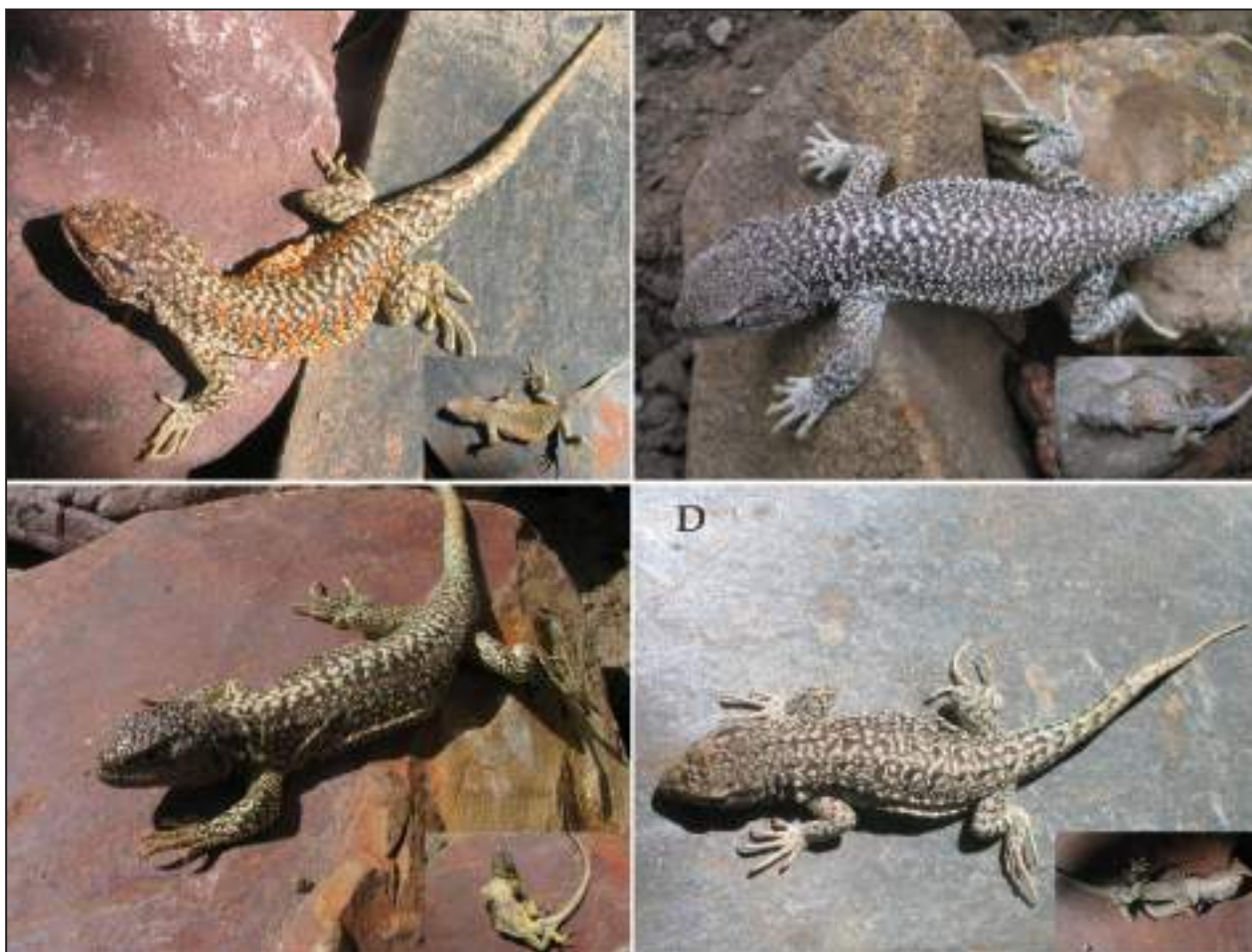
Figura 7. Vista dorsal de machos paratipos de Liolaemus terani sp nov. A-B-D: Cazadero Grande, Catamarca. C: 22 km al sureste de Cazadero Grande, Catamarca.

Paratipos. FML 1404-2-5: Mismos datos que el holotipo.