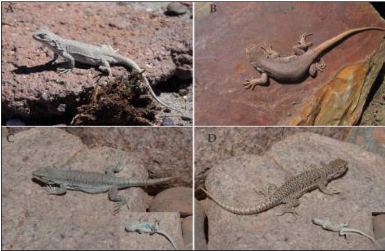
Figura 8. Vista dorsal de hembras paratipos de Liolaemus terani sp nov. A: Las Grutas, Catamarca. B: 22 km al sureste de Cazadero Grande, Catamarca. C-D: Cazadero Grande, Catamarca.

L. nazca , L. orientalis , L. orko , L. ortizi , L. pachecoi , L. polystictus , L. qalaywa , L. tajzara , L. thomasi , y L. williamsi especies que tienen escamas dorsales imbricadas, y con quilla evidente.