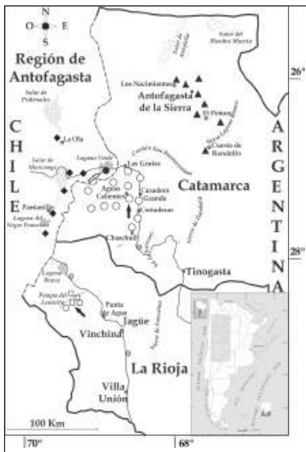
Figura 1. Distribución de algunas especies relacionadas con Liolaemus andinus en las provincias de Catamarca y La Rioja, Argentina y el este de Antofagasta, Segunda Región Administrativa, Chile (para detalles geográficos ver el Apéndice 1). Círculo negro: Liolaemus andinus . Diamante negro: Liolaemus rosenmanni . Triángulo negro: Liolaemus poecilochromus . Cuadrado abierto: Liolaemus sp. nov. 1. Círculo abierto: Liolaemus sp. nov. 2. Flechas indican la localidad tipo de las especies.

Liolaemus , las cuales eran asignadas, confundidas o relacionadas a L. andinus . Si bien son varios los caracteres que se tuvieron en cuenta para analizar y determinar la posición taxonómica de cada ejemplar estudiado, el dato determinante y excluyente con que se contaba era el número de escamas alrededor del cuerpo. Esto se desprende de la descripción de Kowslowky (1895) y posterior estudio de la serie tipo de Laurent (1982), en el cual indican que el número de escamas alrededor del cuerpo para L. andinus , es mayor a 100. De todas las poblaciones estudiadas, sólo las del sector chileno tienen ese estado carácter; mientras que en las poblaciones del lado argentino, por más próximo al límite con Chile (hasta 5-10 km al este de la frontera), el número de escamas difícilmente sobrepasa el valor de 90. Teniendo como parámetro este carácter, se analizaron los patrones de coloración de las diferentes pobla-