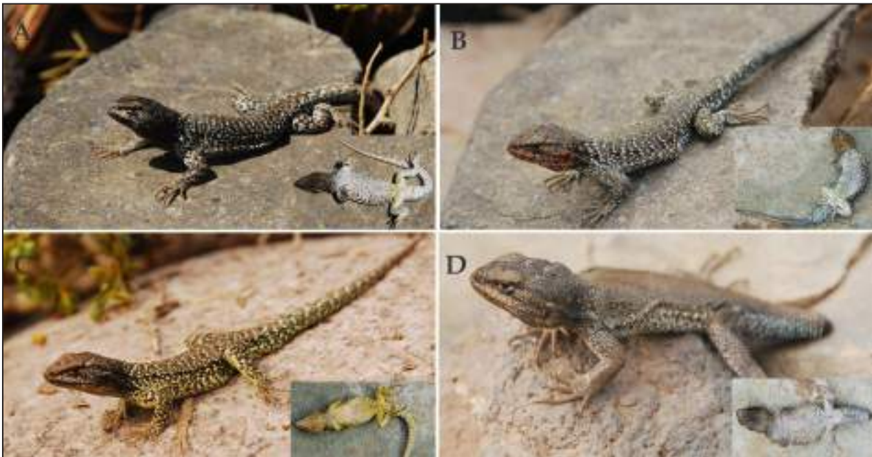
Figura 5. Vista dorsal de machos paratipos de Liolaemus hauthali sp nov. A-B y D: 42 km de Alto Jagüe ruta hacia Pampa del Leoncito, La Rioja. C: Pampa del Leoncito, ruta hacia Laguna Brava, La Rioja.

Interparietal más pequeña o igual que las parietales, rodeada por 5-8 escamas. Nasal rodeada de 6-7 escamas. Cinco a siete infralabiales. Mental en contacto con cuatro escamas. De ocho a 11 temporales lisas. Hasta tres escamas en el margen anterior del meato auditivo y hasta dos en el margen superior. Presencia de pliegues longitudinal, postauricular y antehumeral. Pliegue horizontal en forma de Y entre el hombro y el meato auditivo. Escamas alrededor de la mitad del cuerpo 66-82 ( \bar{X} = 73,9). Gulares 31-45 ( \bar{X} = 36,0). Escamas del cuello (desde el margen posterior del meato auditivo hasta el hombro, a lo largo del pliegue horizontal) 43-57 ( \bar{X} = 48,3). Escamas dorsales entre el occipucio y los miembros posteriores 74-89 ( \bar{X} = 82,2). Ventrales 87-106 ( \bar{X} = 95,5). Machos con cuatro a siete poros precloacales ( \bar{X} = 5,6), hembras con uno a cinco ( \bar{X} = 2,5) poros precloacales. Escamas dorsales laminares, subyuxtapuestas y con quilla leve, aunque en algunos ejemplares se observan algunas escamas en la región vertebral o paravertebral de color negro con quilla más evidente. Escamas ventrales más grandes que dorsales. Dieciséis a 20 laminillas subdigitales en el cuarto dedo de la mano y 21-24 en el cuarto dedo del pie. Sin parche femoral.