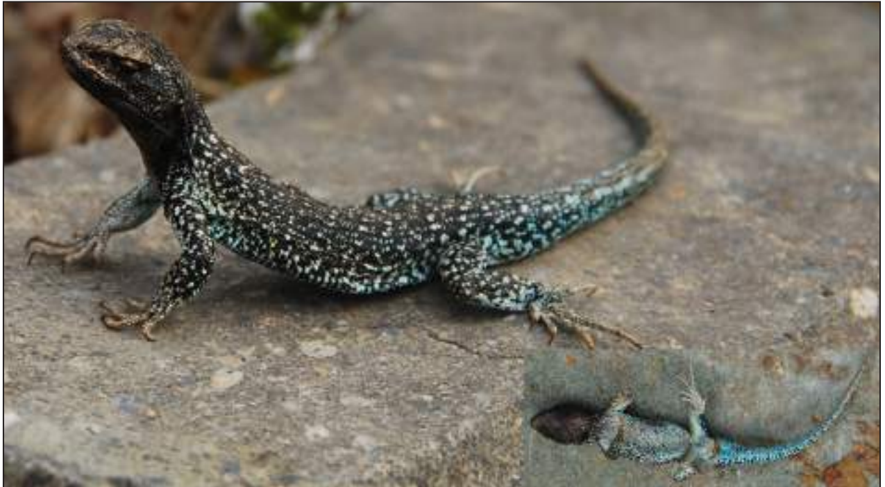
Figura 4. Vista dorsal y ventral del holotipo (macho FML 25984) de Liolaemus hauthali sp. nov.

mente melánica con algunas manchas color castaño, principalmente en la región supraocular y parte de las supralabiales.