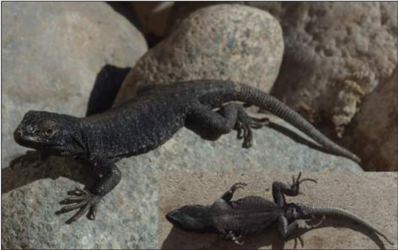
Figura 2. Vista dorsal y ventral del neotipo (macho FML 29867) de Liolaemus andinus , de Laguna Verde, Antofagasta, Segunda Región Administrativa, Chile.

Abdala & Quinteros 2008, L. ortizi Laurent 1982, L. pachecoi , L. pantherinus , L. polystictus , L. qalaywa Chaparro, Quiroz, Mamani, Gutiérrez, Condori, De la Riva, Herrera-Juárez, Cerdeña, Arapa & Abdala 2020, L. signifer , L. tajzara , L. thomasi Laurent 1998, y L. williamsi , especies que tienen escamas dorsales imbricadas, y con quilla evidente. El número de escamas alrededor del cuerpo en L. andinus (99-113) lo diferencian de L. annectens , L. anqapuka , L. audituvelatus , L. cazianiae Lobo, Slodki & Valdecantos 2010, L. chlorostictus , L. dorbignyi , L. duellmani , L. eleodori , L. erguetae , L. etheridgei , L. evaristoi , L. famatinae , L. fittkaui , L. forsteri , L. foxi , L. griseus , L. hajeki Núñez, Pincheira-Donoso & Garín 2004, L. huacahuasicus , L. huayra , L. inti , L. islugensis , L. jamesi , L. melanogaster , L. montanus , L. multicolor , L. orientalis , L. orko , L. ortizi , L. pachecoi , L. pantherinus , L. pleopholis , L. poconchilensis , L. poecilochromus , L. polystictus , L. porosus , L. pulcherrimus , L. puritamensis , L. reichei , L. robertoi , L. robustus , L. rosenmanni , L. ruibali , L. schmidtii , L. scrocchii , L. signifer , L. thomasi , L. torresi , L. vulcanus , y L. williamsi , especies que tienen entre 40-95 escamas alrededor del cuerpo. Todas las hembras paraneotipos de L. andinus no tienen poros prelocales, este