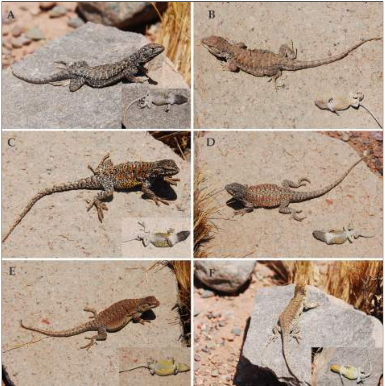
Figura 11. Vista dorsal de ejemplares de Liolaemus rosenmanni . A-D: Machos. E-F: Hembras. A-B: 58 Km al oeste de Laguna Verde, ruta a Maricunga, Chile. C: alrededores del Refugio de la CONAF, Parque Nacional Tres Cruces, Chile. D: alrededores de Pantanillo, Parque Nacional Tres Cruces, Chile. E: alrededores del Refugio de la CONAF, Parque Nacional Tres Cruces, Chile. F: 58 Km al oeste de Laguna Verde, ruta a Maricunga, Chile.

oso et al. (2008), que considera a L. poecilochromus , L. molinai , y L. schmidti como sinónimos junior de L. andinus , coincidimos completamente con Lobo et al. (2010a) y Valladares (2011) en rechazar esa sinonimia. La evidencia morfológica y genética que apoya las diferencias entre L. poecilochromus , L. molinai , y L. schmidti y con L. andinus es concluyente (Abdala et al. , 2019; Aguilar-Puntriano et al. , 2018). Pincheira-Donoso y Núñez (2005) indican que, en Argentina, L. andinus se distribuye en las