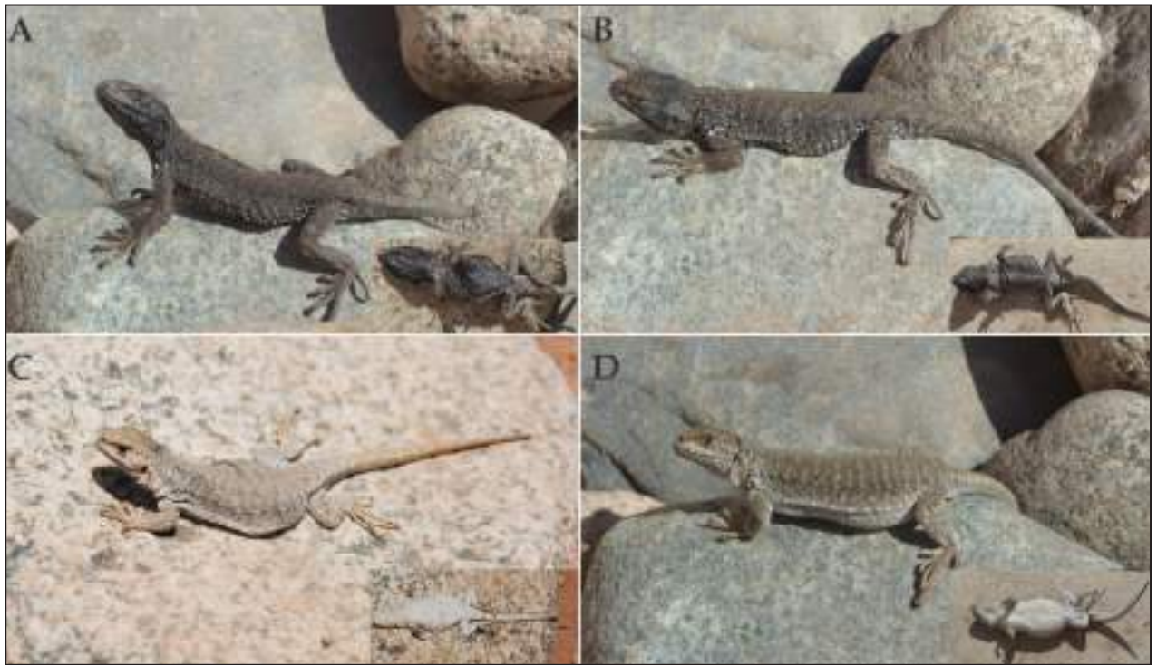
Figura 3. Vista dorsal y ventral de los neoparátipos de Liolaemus andinus , de Laguna Verde, Antofagasta, Segunda Región Administrativa, Chile. A-B: Machos; C-D: Hembras.

más larga (18,3 mm) que ancha (14,3 mm). Altura de la cabeza 10,5 mm. Diámetro del ojo 3,6 mm. Distancia interorbital 9,2 mm. Distancia órbita-meato auditivo 6,1 mm, altura del meato auditivo 3,5 mm; 1,8 mm de ancho. Distancia órbita-comisura de la boca 2,4 mm; Distancia internasal 2,6 mm. Subocular de 2,5 mm. Longitud del muslo 15,2 mm, pierna 14,8 mm y pie 21,0 mm. Longitud del brazo 13,2 mm.