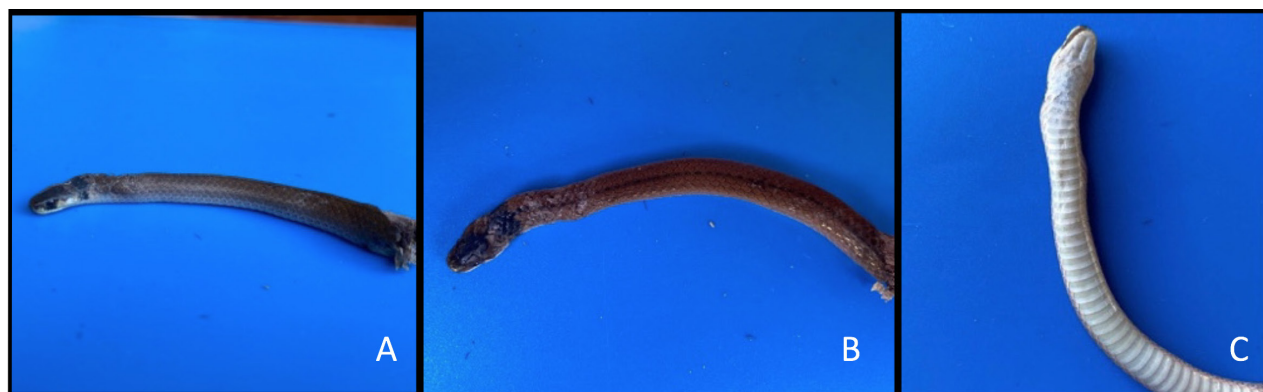
Figura 2. Vista lateral, dorsal y ventral de Tantilla melanocephala (IIBP-H-5659).

una línea vertebral oscura de una escama de ancho que inicia en un collar nucal negro de tres escamas de longitud. El vientre es blanco inmaculado. Debido al estado en que se encontraba el ejemplar, no pudo ser examinado de manera detallada por lo que no se mencionan caracteres merísticos ni morfométricos.