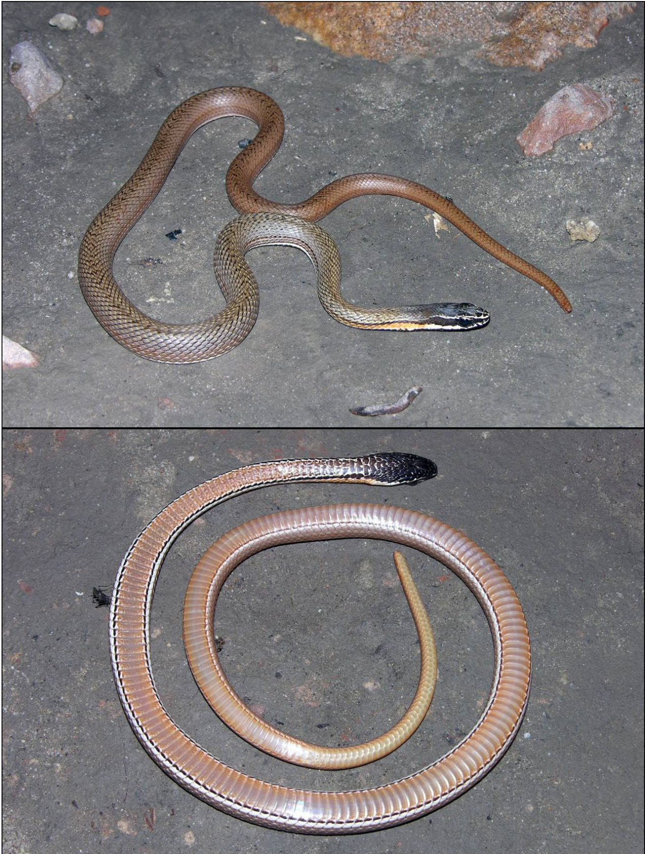
Figura 2. Vista dorsal (arriba) y ventral (abajo) del ejemplar de Philodryas nattereri registrado en Bolivia.