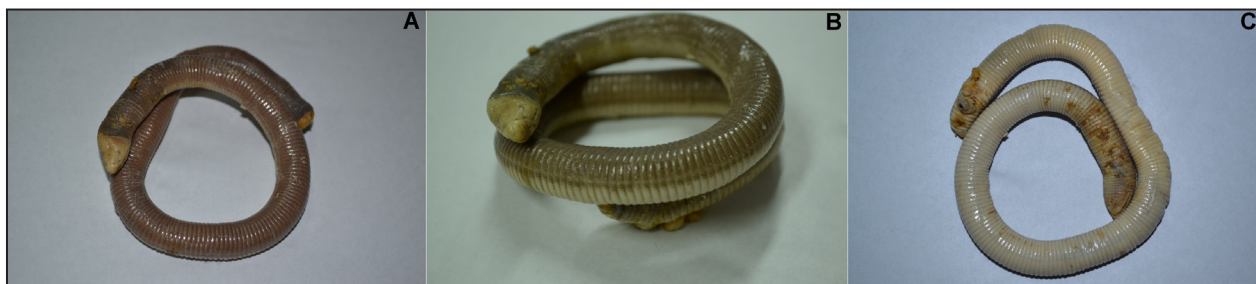
Figura 2. Vista dorsal (A), lateral (B) y ventral (C) de Amphisbaena bolivica (LHC = 275 mm; UNSJ- 3708) colectado en el Departamento Valle Fértil, provincia de San Juan.

2018), siendo el segundo anfisbénido reportado para la provincia junto a Amphisbaena plumbea .