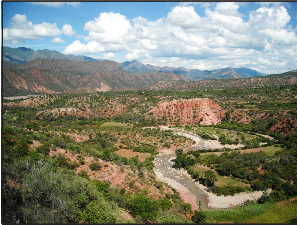
Figura 2. Paisaje de los valles mesotérmicos o interandinos del Parque Nacional Torotoro.

con registros fotográficos por tratarse de especies comunes y observaciones casuales de individuos. La nomenclatura para la identificación taxonómica de anfibios sigue a Frost (2016) y de reptiles sigue a Uetz et al. (2016).