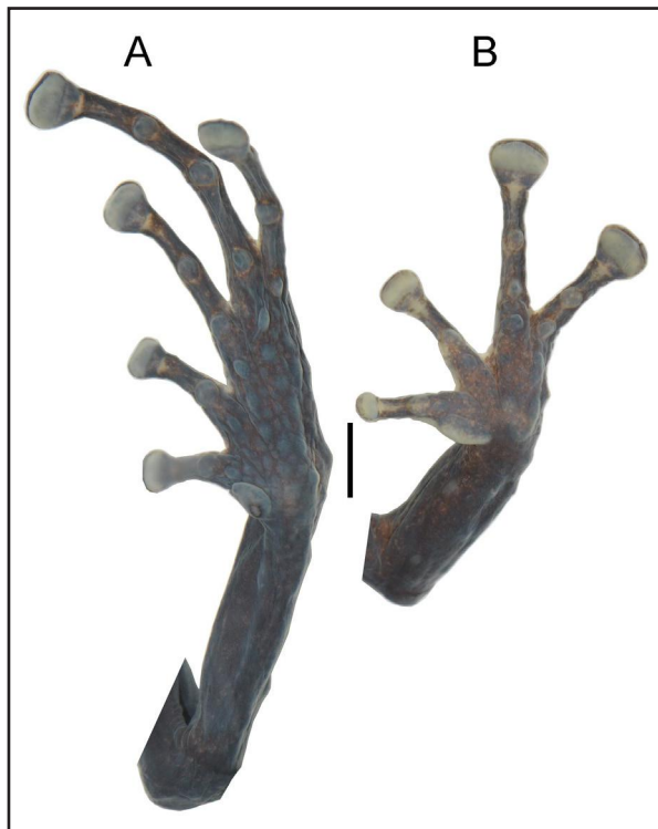
Figura 2. Pristimantis barrigai sp. nov. (EPN 12346) A= vista palmar de la mano y B = vista plantar del pie. Barra 3 mm.

flancos; en la mitad del dorso el mismo color sobre un fondo café verona (37). Las bandas oscuras de los miembros gris mediano neutro (298). Discos de manos y patas blanquecinos; bajo la mandíbula, región pectoral, regiones: gular, mental y ventral de los miembros anteriores de color café verona (37) con salpicaduras más oscuras; zona ventral, incluyendo el vientre y los miembros posteriores gris mediano neutro (98), hacia las ingles la coloración es más clara (café canela). Los discos de las manos y patas blanquecinos, incluyendo el tubérculo tenar y metatarsal interno. Los tubérculos palmares y plantares gris neutro claro (297).