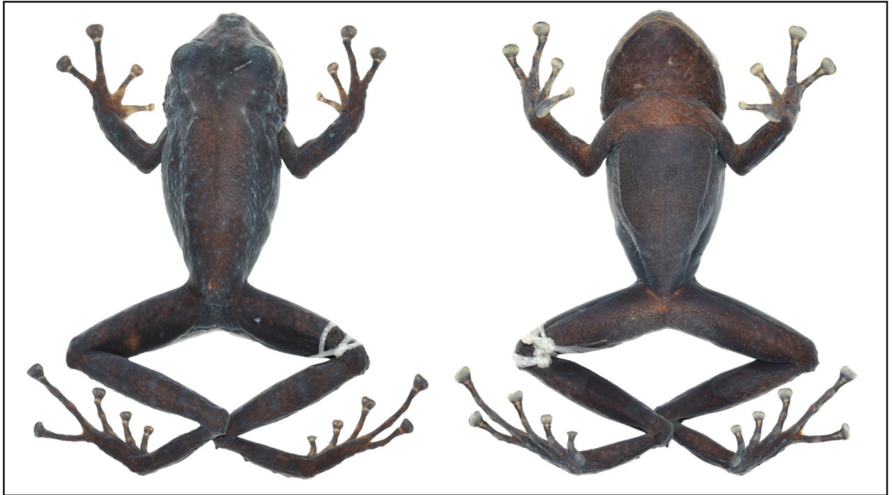
Figura 1. Pristimantis barrigai sp. nov., en preservado. A = vista dorsal y B = vista ventral del holotipo EPN 12346, macho adulto, LRC: 26.9 mm.

(Fig. 1); pliegue supratimpánico y borde superior del tímpano presente, cuatro tubérculos postrictales presentes, agrandados y cónicos; membrana timpánica presente; anillo timpánico pequeño, redondo, su longitud es el 29.7% del diámetro del ojo; coanas pequeñas, ovaladas, ligeramente cubiertas por el arco maxilar; procesos vomerianos triangulares, con seis a ocho dientes agrandados, redondeados en la base y borde anterior cónico, agrupados postero-medialmente; lengua ligeramente más ancha que larga, con el borde posterior bilobulada, la mitad anterior está adherida al piso de la boca. Machos sin hendiduras vocales y con pequeñas almohadillas nupciales en el primer dedo manual. Piel del dorso granular con tubérculos dispersos; pliegues dorsolaterales presentes; superficie ventral areolada; pliegue discoidal presente; cubierta cloacal indistinta; tubérculos agrandados en los alrededores de la cloaca. Tubérculos escapulares cónicos agrandados (Fig. 1); tubérculos pequeños esparcidos en la región ulnar; tubérculo palmar bífido y alargado, tubérculo tenar robusto y alargado, aproximadamente la mitad de anchura que el tubérculo palmar; tubérculos supernumerarios pequeños; tubérculos subarticulares redondeados y elevados en vista dorsal y lateral; dedos manuales con rebordes cutáneos finos, sin membranas interdigitales; dedo I más corto que el