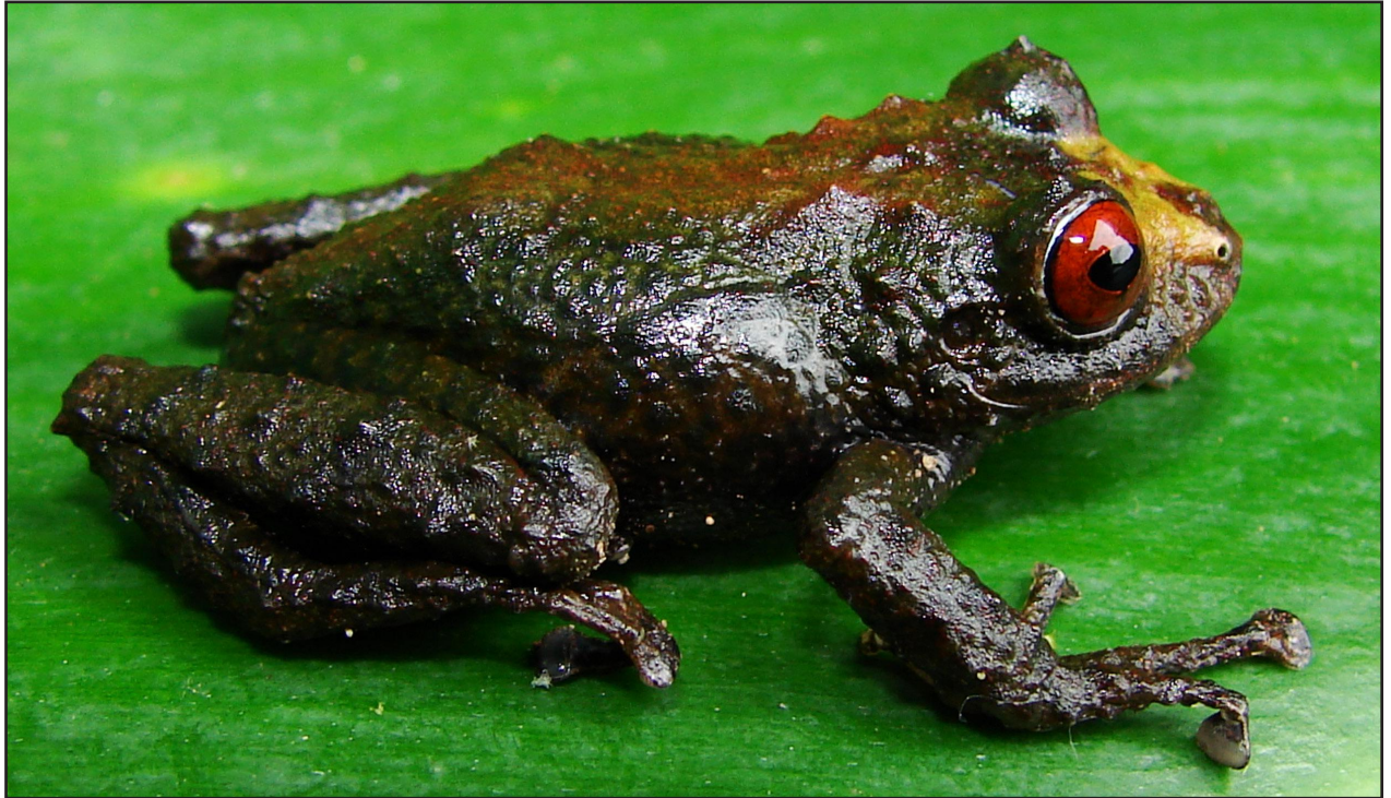
Figura 3. Pristimantis barrigai sp. nov., en vida. Holotipo macho adulto MEPN 12346, LRC: 26.9 mm.

del Cóndor (Ministerio del Ambiente, 2013), el cual está caracterizado por un bosque denso, cuyos arbustos presentan ramas nudosas y abundantes musgos, orquídeas y líquenes. La altura de la vegetación emergente alcanza hasta 15 m de altura, donde dominan arbustos de la familia Melastomataceae, Asteraceae, Araliaceae, Begoniaceae y Arecaceae. Pristimantis barrigai fue recolectado al borde de un riachuelo rodeado de vegetación natural, en la base de la meseta de la zona de Paquisha (Fig. 5A-B), los ejemplares perchaban sobre hojas de Begonia sp., a 3 m de altura.