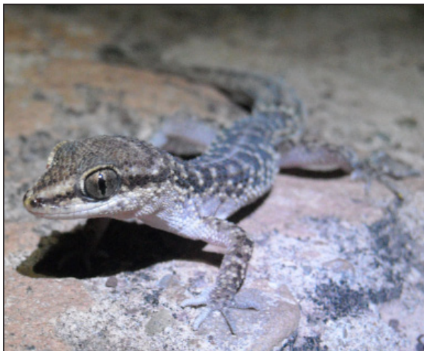
Figura 1. Homonota fasciata (individuo hembra) MHNCR- 526 en Potosí, Bolivia.

Localidad — Homonota fasciata Duméril & Bibron, 1836. Bolivia, departamento de Potosí, Provincia Charcas, Parque Nacional Torotoro, Municipio Torotoro, Comunidades de Torotoro (18° 08' 10.3" S; 65° 46' 29.3" O a 2783 m s.n.m) y Sucusuma (18° 04' 43.2" S; 65° 44' 41.7" O a 2020 m s.n.m). Extiende su distribución 178.5 km al oeste de Bolivia desde Pampagrande (Santa Cruz). Colector: P. Mendoza. En febrero 2009 se lograron registrar 11 individuos en total, de los cuales se colectaron dos especímenes, un individuo adulto "hembra" (MHNCR-526) a las 10:45 hs en la comunidad de Torotoro (Fig. 1) y un individuo juvenil (MHNCR-528) a las 15:00 hs en la comunidad de Sucusuma. Ambos se encontraban en posición de descanso bajo una roca. El hábitat estaba dominado por vegetación arbustiva propia de la ecorregión de los Bosques Secos Interandinos. Los especímenes se encuentran depositados en la colección herpetológica del Museo de Historia Natural Alcide d'Orbigny (MHNCR).