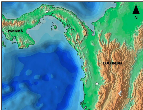
Figura 1. Distribución geográfica de Atractus depressiocellus . Círculo blanco: Reporte de Literatura (Myers, 2003). Estrella corresponde al nuevo registro hecho en el presente trabajo. En el vértice inferior derecho se muestra Colombia y la nueva localidad de distribución de la especie en el país.

El ejemplar UTCH: COLZOOCH-H 1253 es una hembra adulta que posee los principales caracteres de coloración y morfología indicados por Myers (2003), incluyendo (Fig. 2): ojo deprimido muy pequeño, las internasales muy pequeñas, 17-17-17 hileras dorsales lisas, placa anal entera, 160 ventrales (167 reportado por Myers 2003), 30 subcaudales divididas (igual al holotipo), 7 supralabiales, 6 infralabiales en cada lado (7 reportadas por Myers 2003), 1+2 temporales, loreal larga que contacta con el ojo, sin preocular, dos postoculares. El ejemplar presenta una longitud hocico-cloaca de 242 mm, una longitud de cola de 34 mm, un ancho cefálico de 6 mm, un largo cefálico de 12 mm y una altura cefálica de 4 mm. Presenta una coloración café claro en la cabeza y el cuerpo un amarillento marrón, en la parte posterior del cuerpo y en la cola