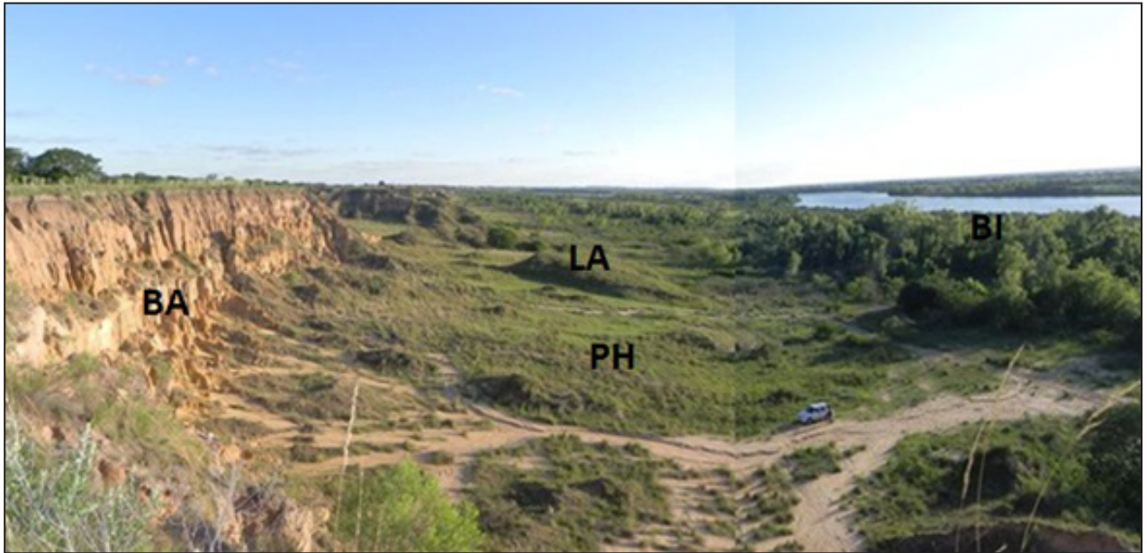
Figura 2. Ambientes presentes en la Reserva Paleontológica del Arroyo Toropí (Corrientes, Argentina). Pastizales heterogéneos con prados anegados y pequeños fragmentos de sabana arbustiva (PH), bosques que acompañan la planicie de inundación del río (BI), barranca (BA) y lomada arenosa (LA).

con formol al 10%, conservados en alcohol al 70% y depositados en la Colección Herpetológica de la Universidad Nacional del Nordeste, Corrientes (UN-NEC) (Apéndice I). Registros fotográficos fueron realizados en aquellos casos que la colecta de los especímenes no fue posible. Cabe mencionar que en algunos casos la presencia de una especie dada se registró por el avistaje, sin ser exitosa su captura o fotografiado, o simplemente por oír su canto sin ser vista (ver Tabla 1).