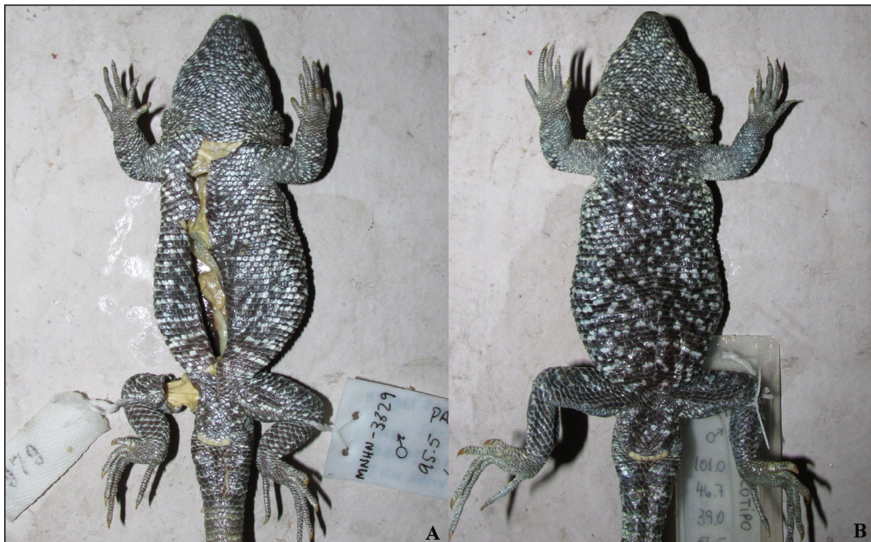
Figura 3. Comparación del diseño y color ventral. A) Holotipo de Liolaemus filiorum (MNHN-CL 3829). B) Holotipo de L. puritamensis (MNHN-CL 1880).

Dados todos los antecedentes expuestos sobre la escasa y confusa información disponible sobre Liolaemus filiorum , propongo considerar a esta especie un sinónimo menor de L. puritamensis dado que: 1) No he encontrado diferencias entre ambas especies para los caracteres de diagnóstico propuestos por Pincheira-Donoso y Ramírez (2005) ni en otros caracteres relevantes de escamación (Tabla