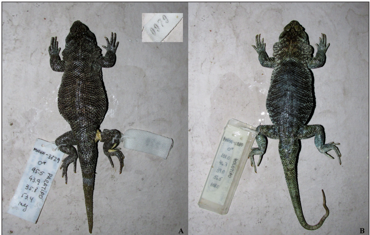
Figura 2. Comparación del diseño y color dorsal. A) Holotipo de Liolaemus filiorum (MNHN-CL 3829, longitud hocico-cloaca = 95.5 mm). El recuadro superior a la derecha muestra el detalle de la etiqueta original (DBCUCH 0979). B) Holotipo de L. puritamensis (MNHN-CL 1880, longitud hocico-cloaca = 101.0 mm).

Departamento de Biología Celular y Genética, Universidad de Chile). Debo recalcar que la colección DBCUCH fue donada hace algunos años al Museo Nacional de Historia Natural y por eso este espécimen posee ahora dos etiquetas. Aunque el ICZN (1999) establece claramente en el Art. 73.1.1 que “if an author when establishing a new nominal species-group taxon states in the original publication that one specimen, and only one, is the holotype, or “the type”, or uses some equivalent expression, that specimen is the holotype fixed by original designation” (si un autor al establecer un nuevo taxón nominal de nivel especie hace constar en la publicación original que un ejemplar, y sólo uno, es el holotipo o “el tipo” o usa alguna expresión equivalente, ese ejemplar es el holotipo fijado por designación original), verifiqué los datos de los especímenes MNHN-CL 3828 y 3830, para descartar un error de tipeo en Pincheira-Donoso y Ramírez (2005). Sin embargo, el espécimen MNHN-CL 3828 corresponde a un paratipo de Phymaturus alicahuense (Núñez et al. , 2010); y el espécimen MNHN-CL 3830 corresponde a un paratipo de L. puritamensis . Además, de acuerdo al Sr. H. Núñez (com. pers.), aunque en la colección