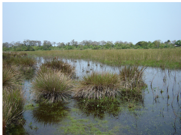
Figura 2. Hábitat de Rhinella azarai en la Reserva Natural Provincial Isla Apipé Grande (Corrientes, Argentina).

Con respecto a la dieta, el 91% ( n=20 ) de los estómagos analizados presentaron contenido. Se encontró un total de 180 presas entre las que se identificaron himenópteros, coleópteros y hemípteros. El análisis del contenido digestivo se resume en la Tabla 1. En cuanto a la jerarquización de la dieta, Hymenoptera (todos pertenecientes a la familia Formicidae) fue categorizada como fundamental, Coleoptera (Carabidae, Crysomelidae, Curculionidae, Elateridae, Scarabeidae y otros no identificados) como accesorio y Hemiptera (Heteroptera) como accidental. Esta tendencia al consumo de hormigas coincide con lo observado en otras especies de Rhinella del grupo granulosa del nordeste argentino, tales como R. bergi , R. major y R. fernandezae (Duré et al. , 2009). Esto podría deberse a la abundancia de dichos insectos en los ambientes y a su agregación en los mismos, constituyendo una presa de fácil captura que compensa el bajo rendimiento energético (Quatrini et al. , 2001). Además es conocida la relación existente entre la mirmecofagia y la producción de